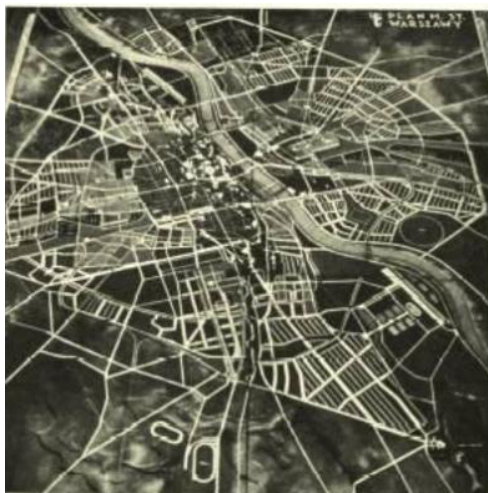
Rycina 6. Ogólny plan zagospodarowania przestrzennego Warszawy z 1931 r. W łuku Wisły w południowej części miasta widoczny tor regatowy i park sportowy. Dostrzec można również planowane lotnisko komunikacyjne na Gocławiu