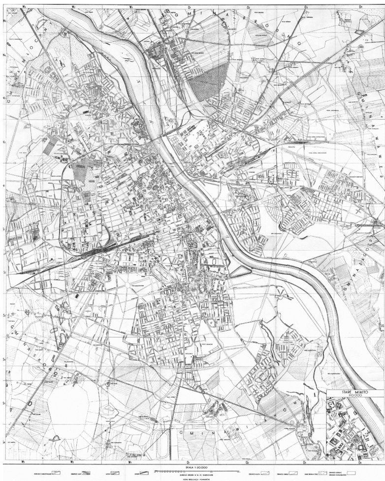
Rycina 7. Plan Warszawy z 1939 r. z zaznaczoną osią regatowego.