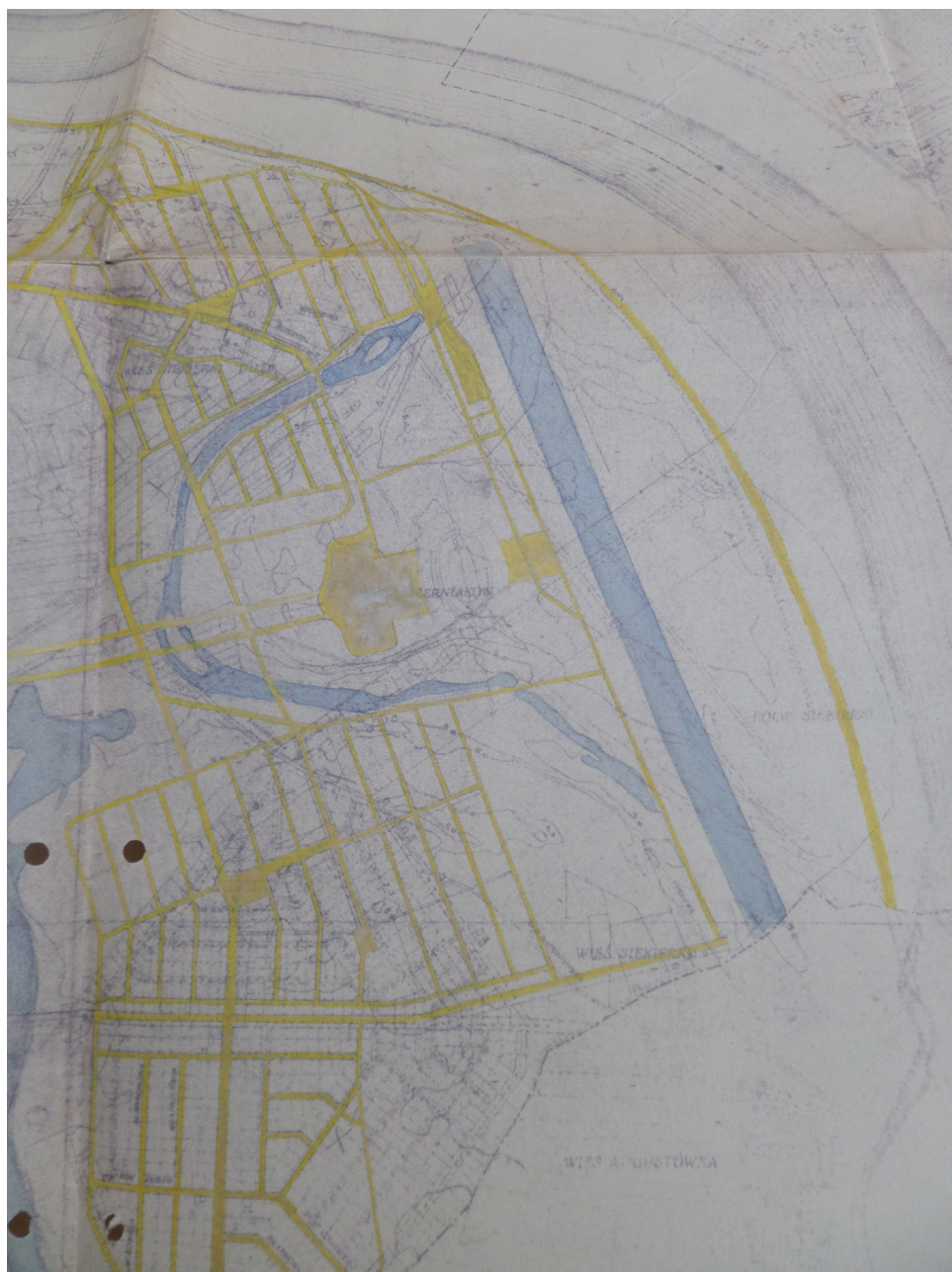
Rycina 4. Siekierki. Plan zabudowania w skali 1:10000. Schemat sieci komunikacyjnej.