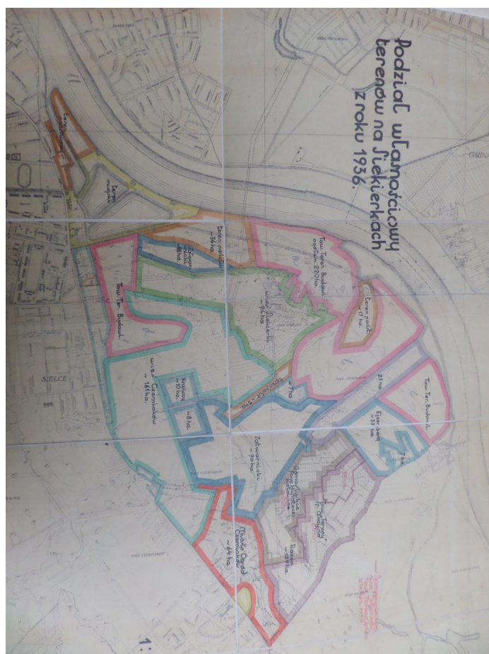
Rycina 1. Podział własnościowy terenów na Siekierkach, 1936. Źródło: APW, 3/88344

racji Wioślarskiej (FISA) i mogłoby uniemożliwić organizację międzynarodowych zawodów na tak przygotowanym torze. Wskazywano też na bardziej prozaiczne problemy wynikające z takiego rozwiązania, argumentując, że spowoduje ono spadek frekwencji na trybunach toru (i dochodów z biletów wstępu na imprezy sportowe), gdyż publiczność, chcąc podziwiać i dopingować wioślarzy, będzie się gromadziła na wiadukcie trasy komunikacyjnej. Przedstawiciele PZTW wnioskowali o przesunięcie trasy na południe, poza obręb toru (APW, 3/8831, k. 11). Prośby te, pomimo początkowego oporu władz miasta (APW, 3/8907, k. 26) 8 , zostały uwzględnione i w planach z 1939 r. trasa Wawer-Raszyn była już wytyczona nieco dalej na południe i nie przecinała osi toru regatowego ani nie ingerowała przestrzennie w tereny sportowe o skali ogólnopolskiej i międzynarodowej (APW, 3/8840, k. 2) 9 .