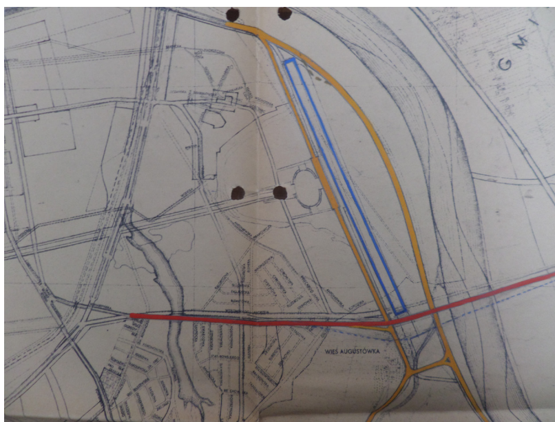
Rycina 2 i 3. Studium do planu zabudowania terenów na południe od Warszawy z 1936 r. (z widoczną trasą komunikacyjną Wawer–Raszyn przecinającą tor regatowy) oraz korekta tego studium z trasą zaproponowaną przez Dział Regulacji i Pomiarów (1939).