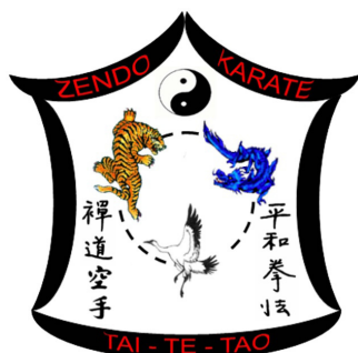
Ryc. 2. Projekt logo Zendo karate Tai-te-tao autorstwa sensei Bachmeiera (emblem – zbiory własne autora)