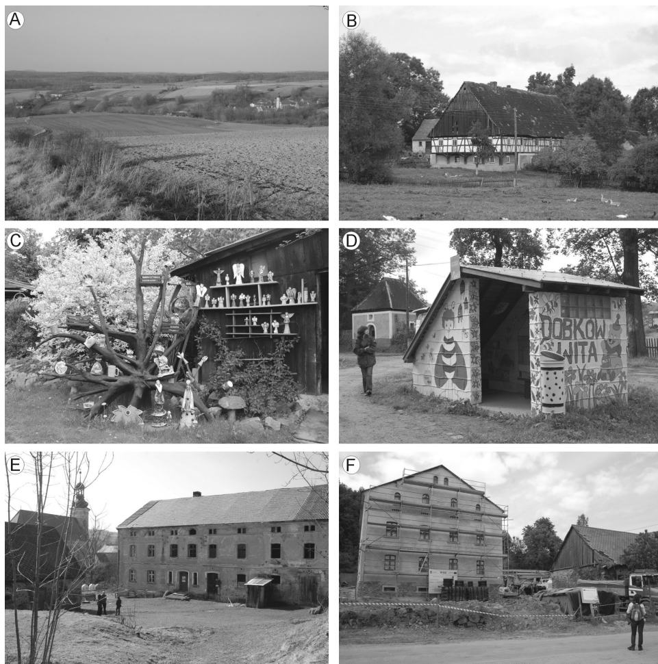
Ryc. 3. Oblicza Dobkowa. A – panorama wsi położonej w dolinie Bukownicy, widziana od południa; B – jedno z zabytkowych gospodarstw rolnych; C – jedna z galerii ceramiki we wsi; D – odnowiony przystanek autobusowy w dolnej części wsi; E – dawna zagroda frankońska przed rozpoczęciem prac remontowych; F – prace remontowo-adaptacyjne w Sudeckiej Zagrodzie Edukacyjnej