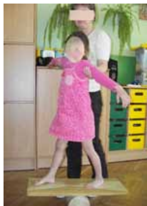
Ryc. 4. Asekuracja czynna dziecka za staw barkowy