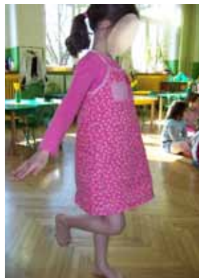
Ryc. 1. Równowaga statyczna – stanie na jednej kończynie dolnej (próba „flaminga”)