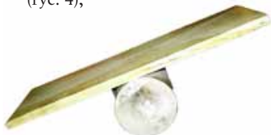
Ryc. 2. Balance master