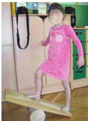
Ryc. 3. Próba wejścia dziecka na balance master